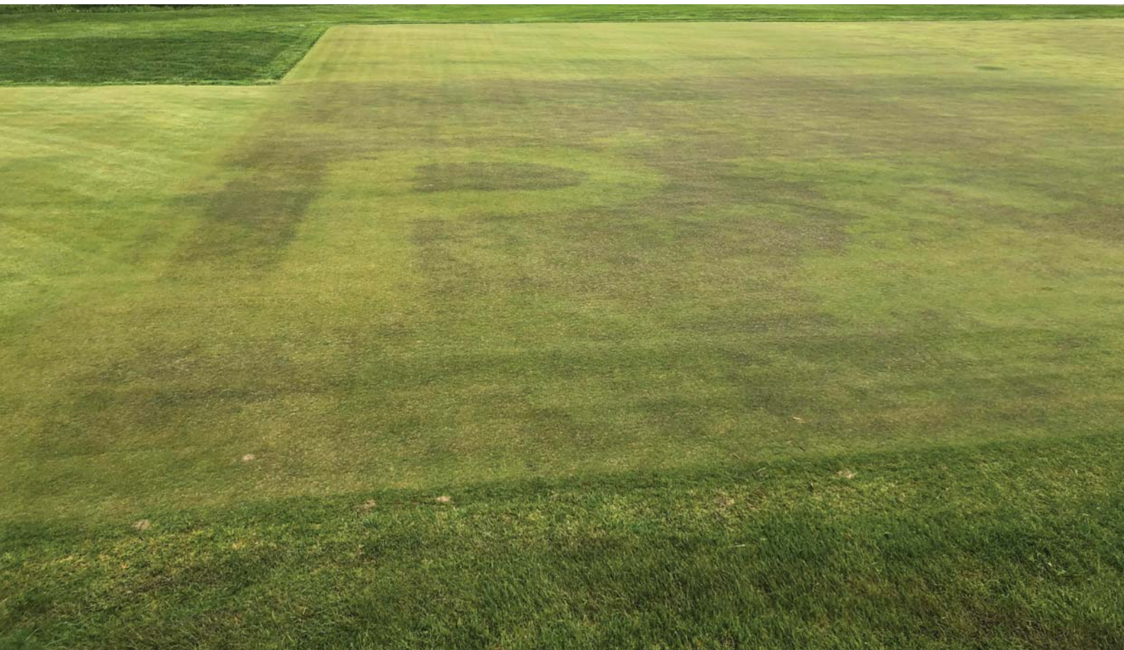
▲ Figur 1: Ved fosformangel bliver planterne violette.

de eller granuleret gødning påvirker helhedsindtryk (turfgrass quality) og "spring green-up" i etableret græs.