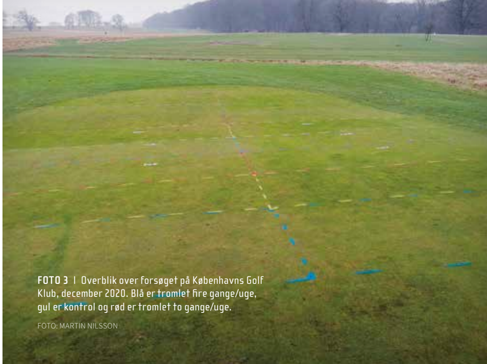
FOTO 3 | Overblik over forsøget på Københavns Golf Klub, december 2020. Blå er tromlet fire gange/uge, gul er kontrol og rød er tromlet to gange/uge.

Martins vurdering var også, at tromlede parceller fra august-december så bedre ud end dem, der blev tromlet fra juni-december, men der var ikke statistisk sikker forskel her.